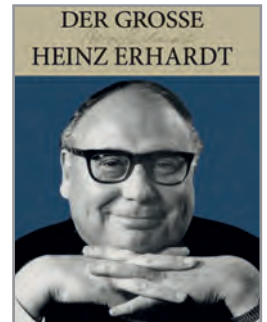
© Aus: „Das große Heinz Erhardt“-Buch, 2009 Lappan Verlag, Oldenburg