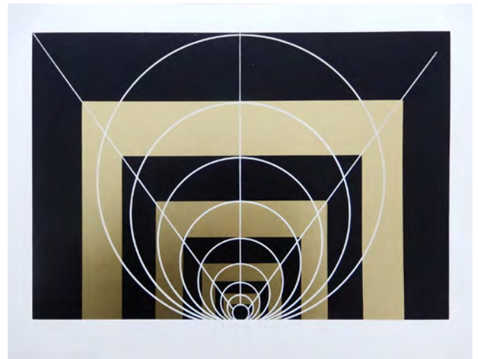
Jaroslav Šváb, Komposition , 1974, Linolschnitt, 24,5 x 36 cm

2024 feiert das Grafikmuseum Stiftung Schreiner ein doppeltes Jubiläum: 30 erfolgreiche Jahre mit zahlreichen, vielbeachteten Ausstellungen von regional, national und international renommierten Künstlern im seit 35 Jahren vereinten Deutschland, die weit über Oberfranken hinausstrahlen. Unter dem Motto »Nur Papier, und doch die ganze Welt. 30 Jahre Grafikmuseum Stiftung Schreiner Bad Steben« besinnen wir uns einmal mehr auf Ostdeutschland und Osteuropa als den beiden Sammlungsschwerpunkten dieses in Deutschland einzigartigen Spezialmuseums.